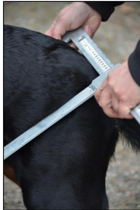
Kuva 6. Lantion leveyden mittaus.