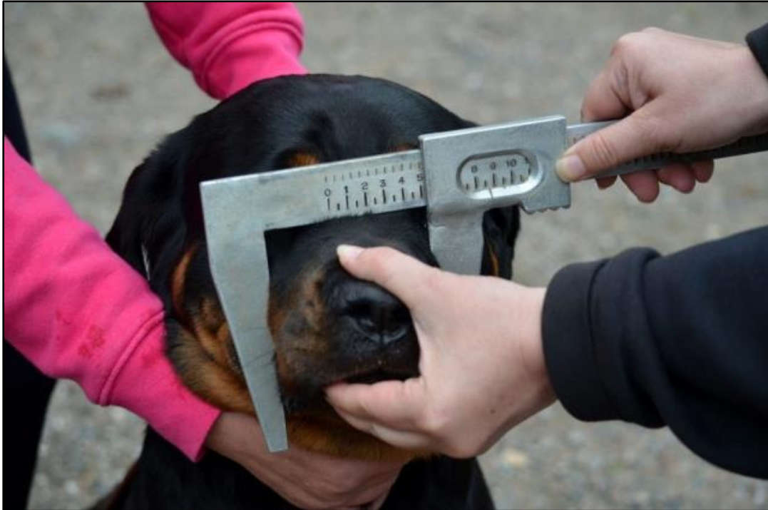
Kuva 8. Kuonon leveyden mittaaminen.