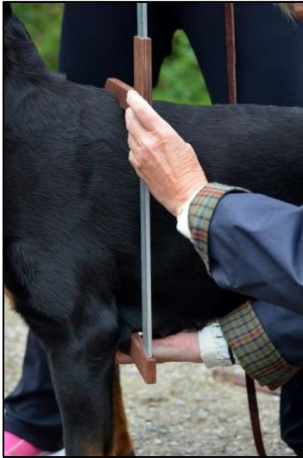
Kuva 3. Rintakehän syvyyden mittaus.

Rungosta mitataan rintakehän syvyys (kuva3), joka rotumääritelmän mukaan tulisi olla noin 50% säkäkorkeudesta. Lisäksi mitataan rinnanympäryys (kuva4), rintakehän leveys (kuva5) ja lantion leveys (kuva 6).