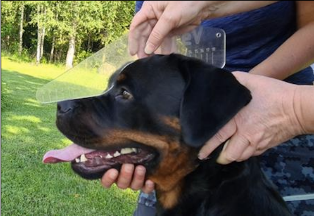
Kuva 6. Kuonon ja kallon pituuden mittaus.

Päästä mitataan sapluunalla kuonon ja kallon pituus (kuva6). Näiden pituudesta lasketaan kuonon – ja kallonpituussuhde, jonka tulisi rotumääritelmän mukaan 40%/60%. Pienellä metallimitalla mitataan kallon leveys, kuonon leveys ja kuonon syvyys (kuva 7,8,9).