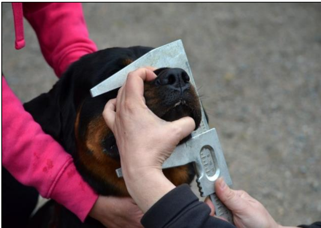
Kuva 9. Kuonon syvyyden mittaaminen.