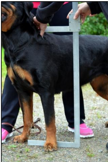
Kuva 1. Säkäkorkeuden mittaus.

Mittaukset aloitetaan yleensä säkäkorkeuden mittauksella (kuva 1.), tämä mitataan lapojen päältä. Seuraavaksi mitataan rungonpituus rintalastan kärjestä istuinluuhun, koiran tulee seisoa ryhdikkäästi suorassa linjassa (kuva 2.). Näiden suhdeluvun tulisi olla 1. Suhdeluku on sitä suurempi mitä pidempi rungonpituus on suhteessa rotumääritelmä.