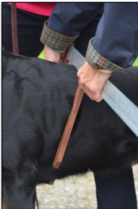
Kuva 5. Rintakehän leveyden mittaus.