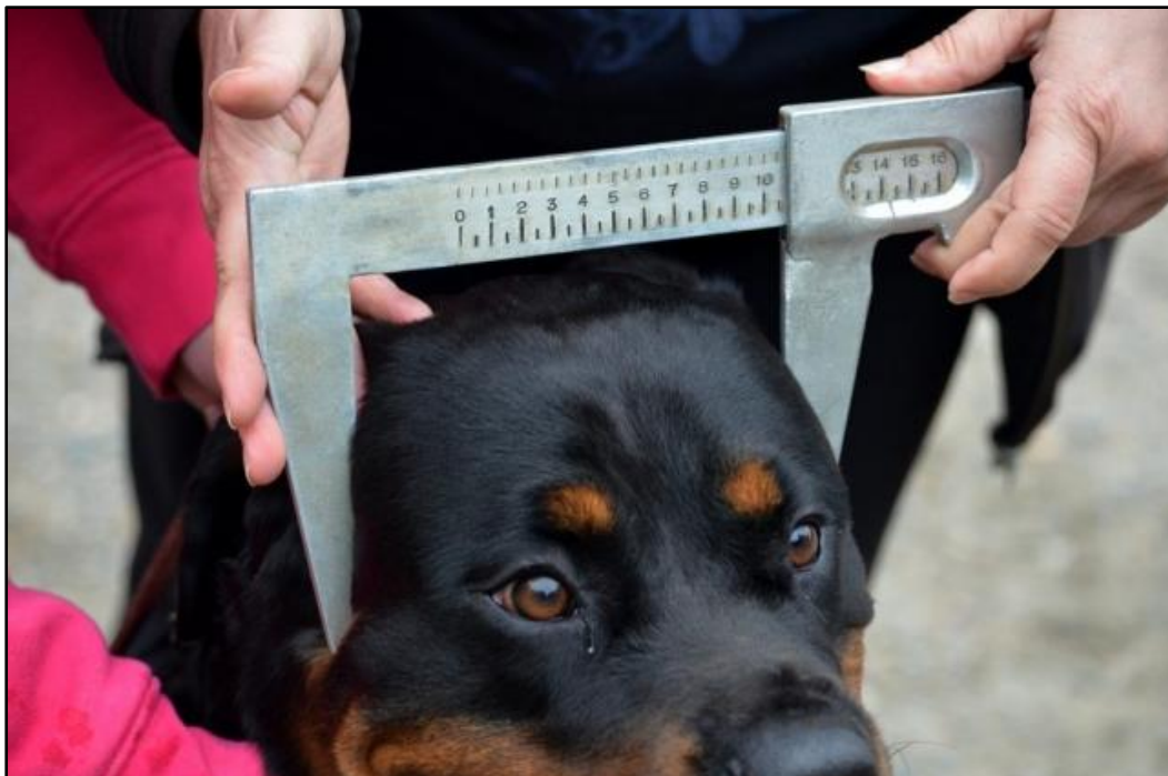
Kuva 7. Kallon leveyden mittaaminen.